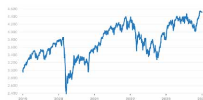
Euro Stoxx 50